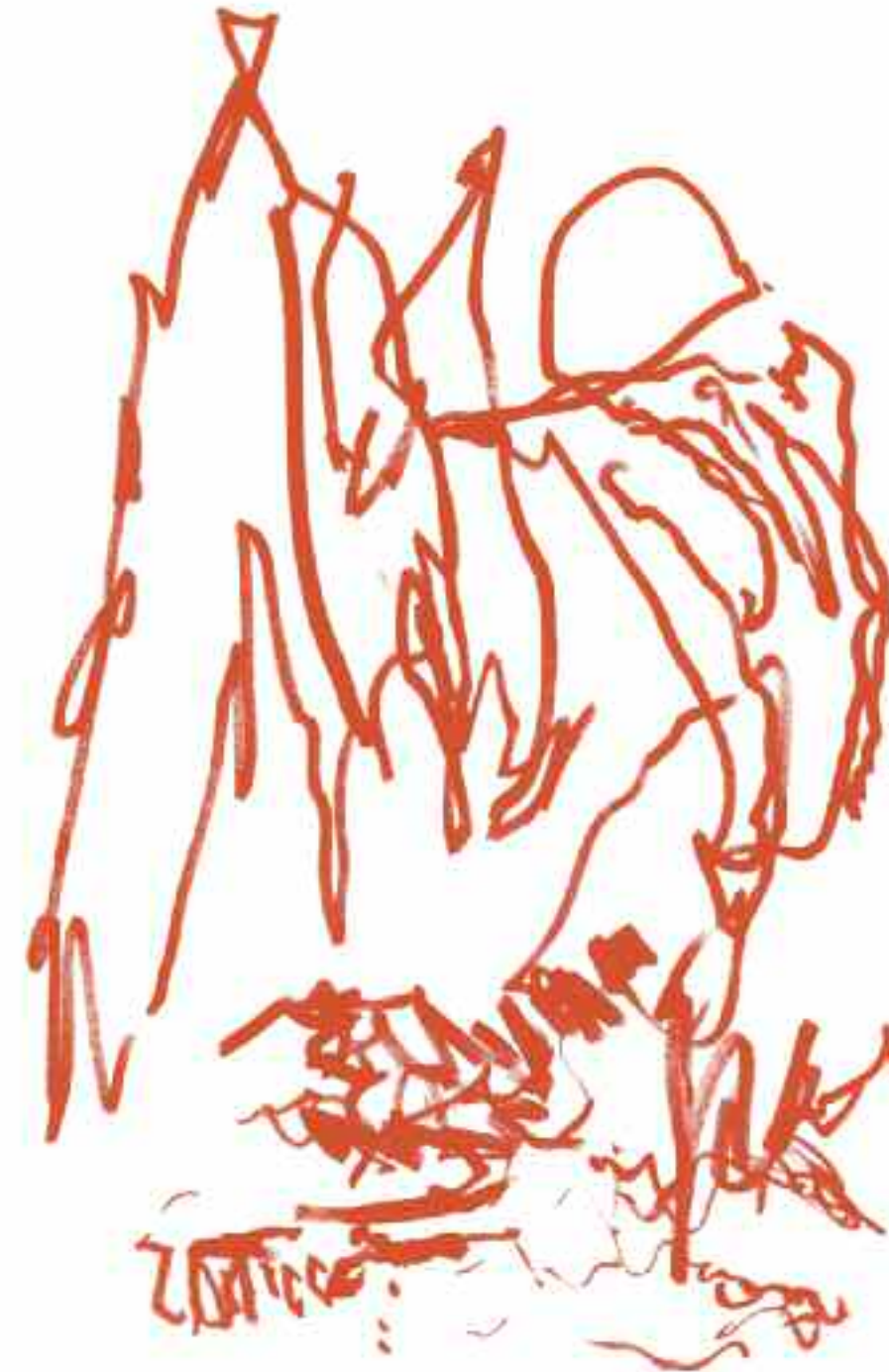
2003 | Filzstift auf Bütten 40x30 cm