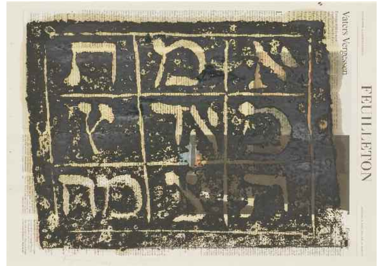
2008 | Holzdrucke auf Zeitungspapier 70x50 cm