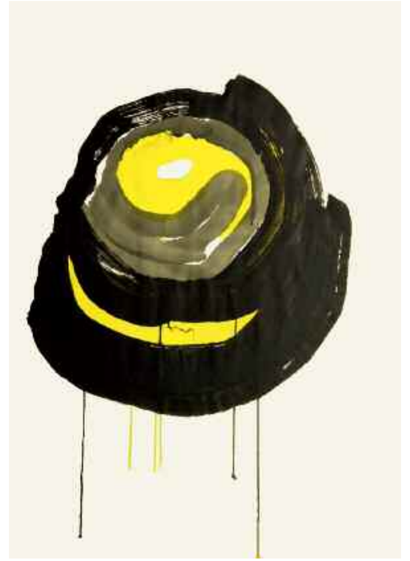
2004 und 2005 | Acryl auf Leinwand • 100x70 cm • 100x70 cm • 120x 85 cm • 100x70 cm