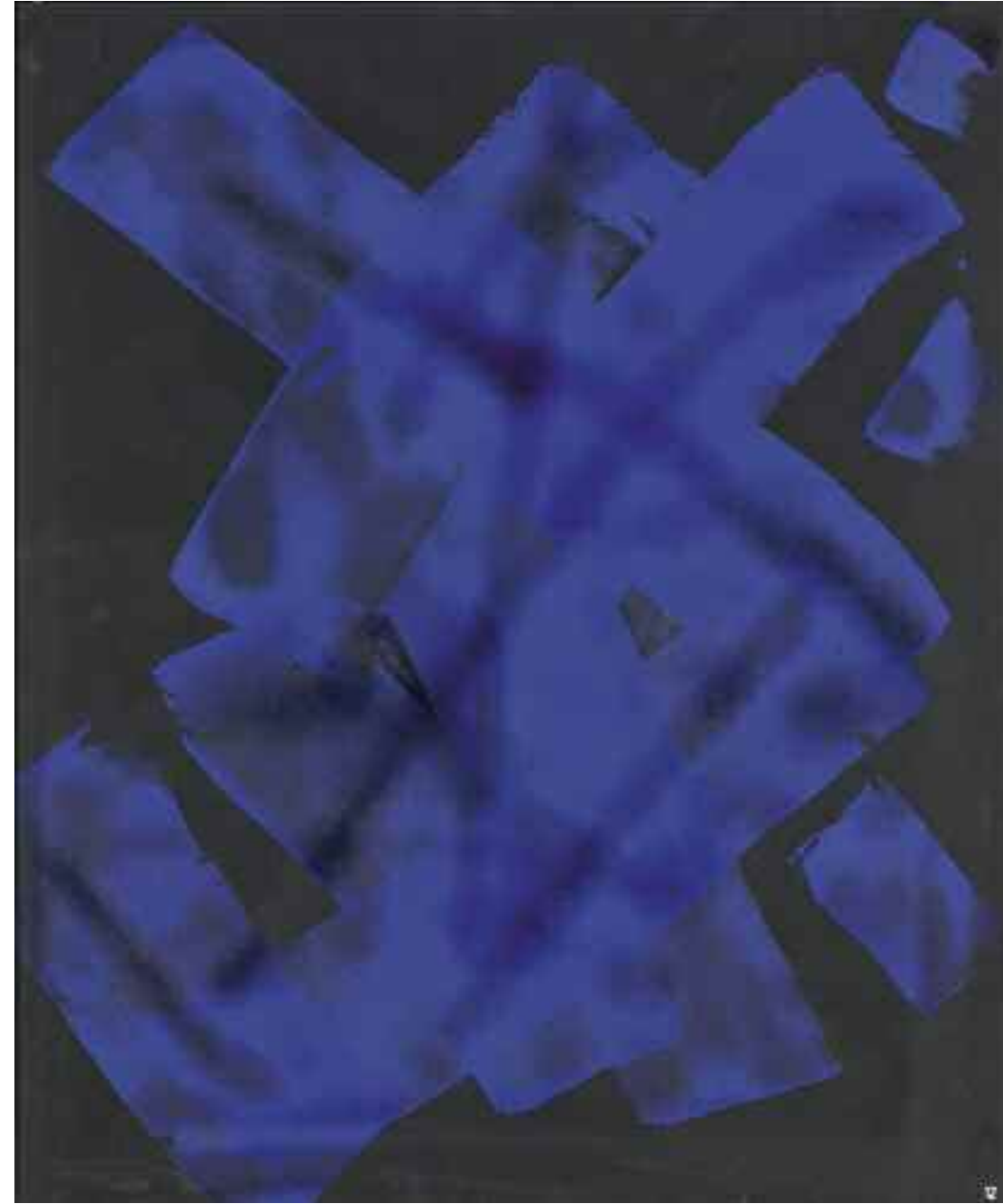
2008 | Acryl auf Leinwand 62x53 cm