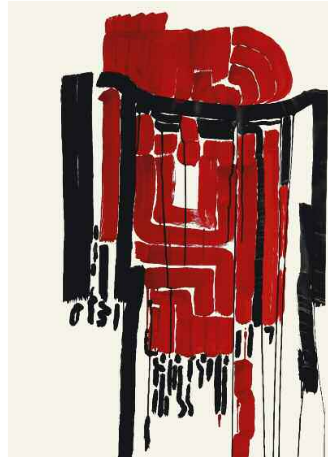
2005 | Acryl auf Leinwand 140x 100 cm