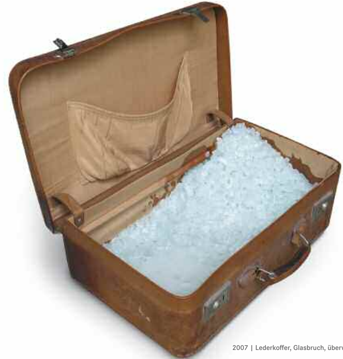
2007 | Lederkoffer, Glasbruch, überwacht 60x40x15 cm